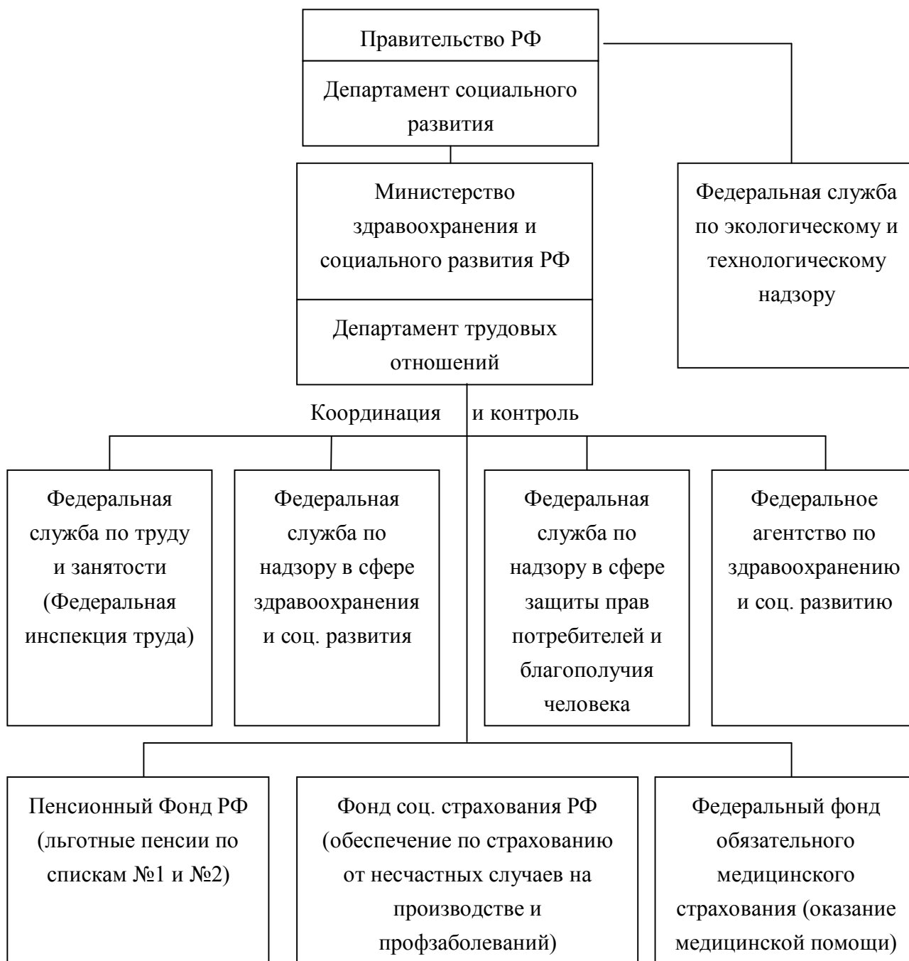
Рис. 3. Система государственного управления охраной труда

нарушений, привлечении виновных к ответственности в соответствии с законодательством РФ.