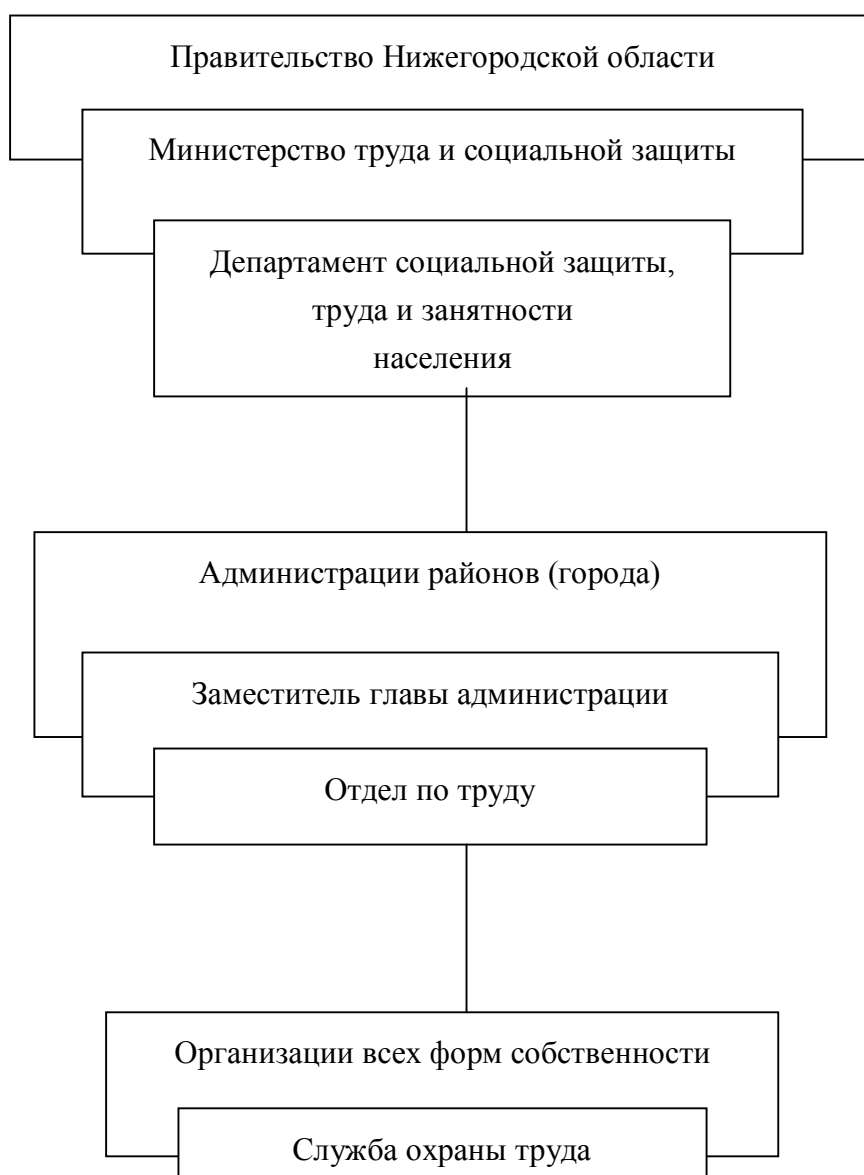
Рис. 4. Схема государственного управления охраной труда в Нижегородской области

Схема государственного управления охраной труда в Нижегородской области представлена на рис. 4.