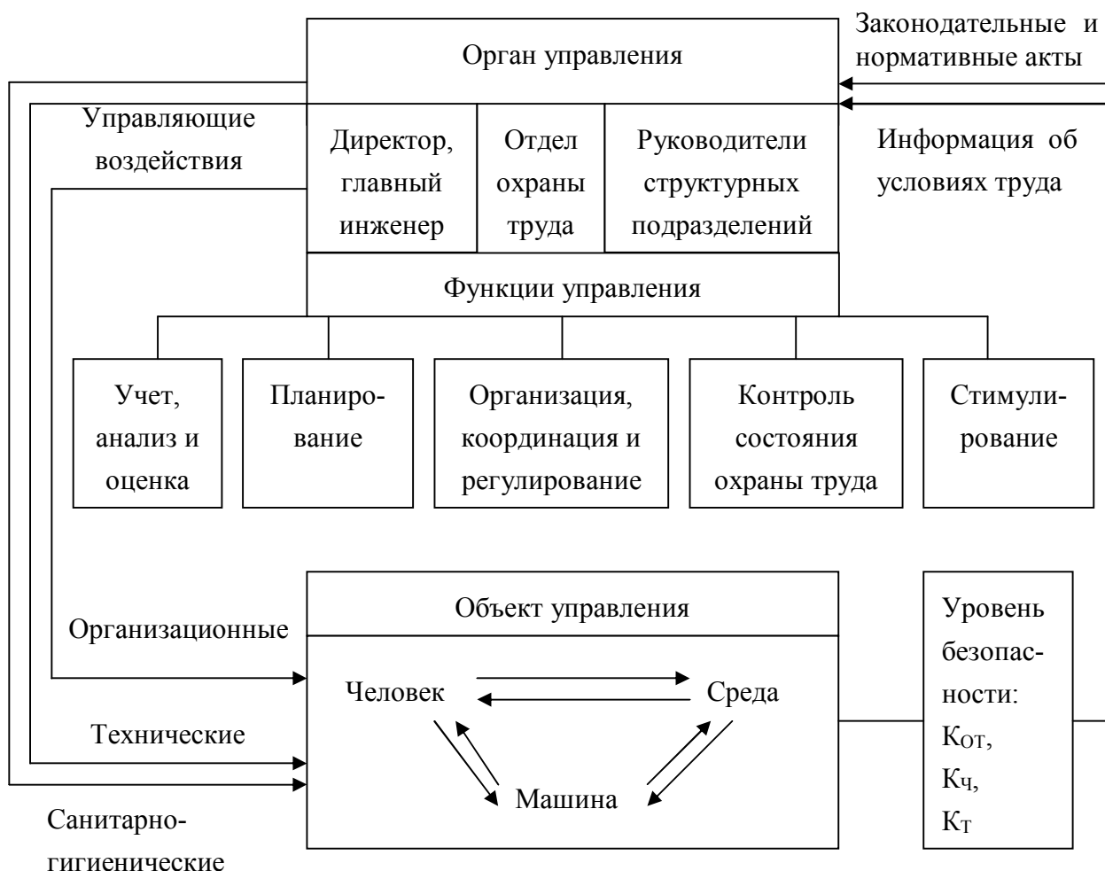
Рис. 2. Функциональная схема управления безопасностью труда

Управление безопасностью труда происходит с помощью управляющего органа, включающего администрацию предприятия, руководителей структурных подразделений, службу охраны труда на основе информации о состоянии объекта управления.